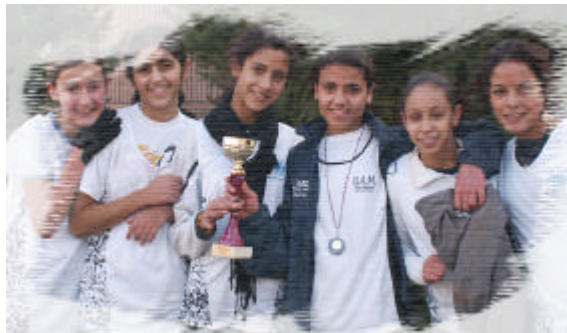
Chp Régionales par équipe en Cross